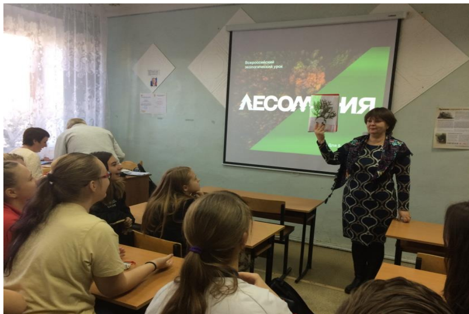
Игровая программа «Лесомания»

Профиль лагеря: естественнонаучное направление