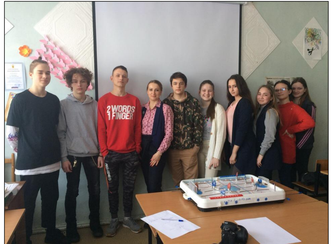
3 отряд 14-16 лет