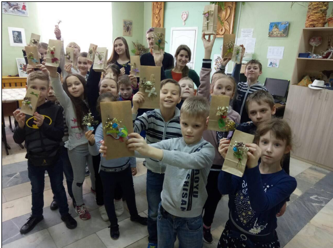
1,2 отряды 7-11 лет