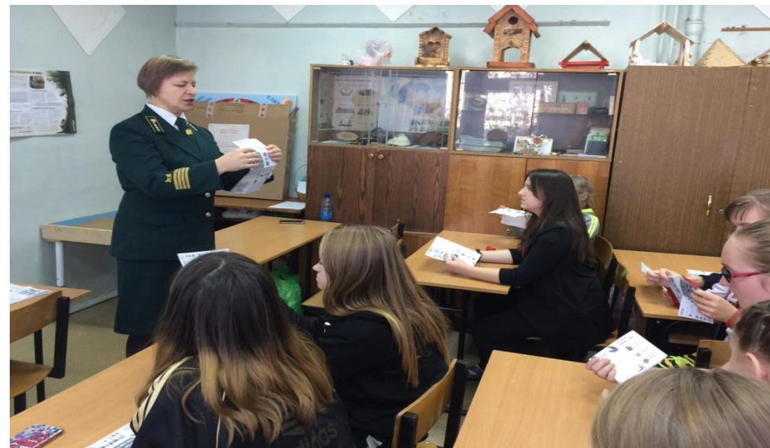
Практическое занятие с преподавателями Рыбинского лесотехнического техникума